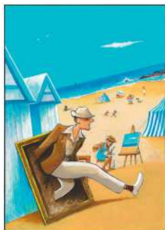
© O. Suptot, A. Le Gouëfflec, Glénat

Durée : 1h – Tout public – Gratuit sur réservation au 02 44 73 45 60