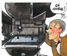
© O. Suptot, A. Le Gouëfflec, Glénat

Durée : 1h – Tout public – Accès libre et gratuit (RDV sur l'esplanade de M. Hulot)