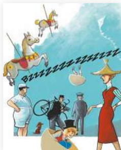
© O. Suptot, A. Le Gouëfflec, Glénat