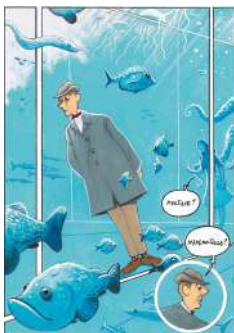
© O. Supiot, A. Le Gouëfflec, Glénat