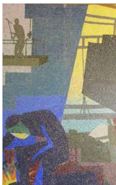
© Paul Colin, Ville de Saint-Nazaire