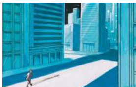
© O. Supiot, A. Le Gouëfflec, Glénat